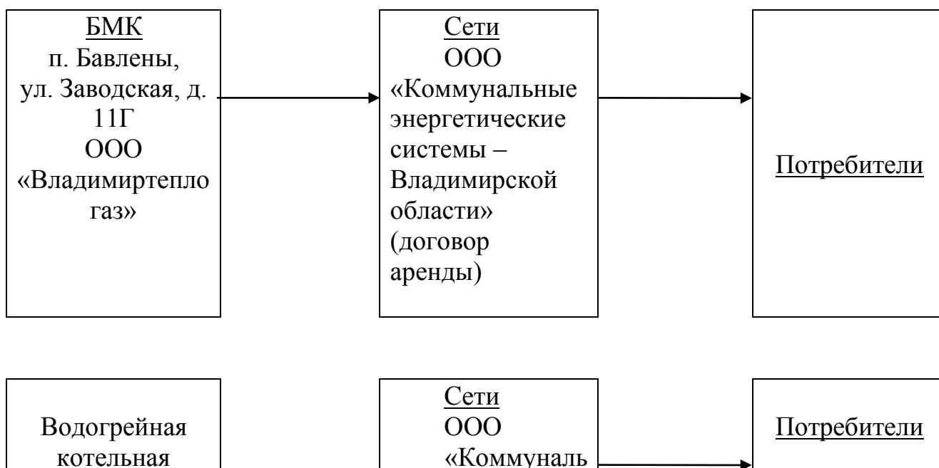
Рисунок № 1

Схема теплоснабжения Бавленского поселения от источников тепла представлена на рисунке № 1