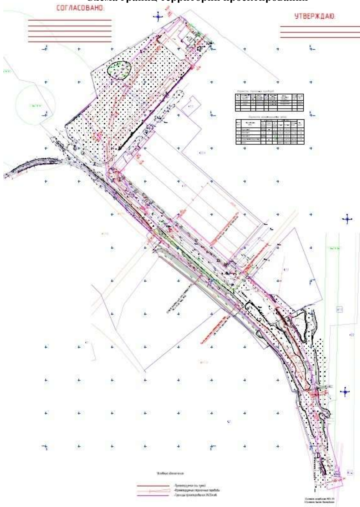
Схема границ территории проектирования