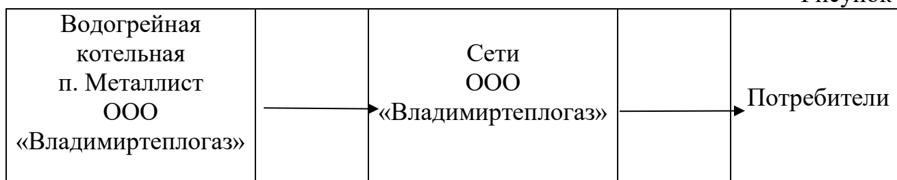
Рисунок № 1

Водогрейная котельная Флорищинского поселения, находится на обслуживании ООО «Владимиртеплогаз». В качестве основного топлива на котельной используется природный газ. Отопительный период длится 213 суток. На водогрейной котельной п. Металлист не предусмотрена круглогодичная выработка тепловой энергии на горячее водоснабжение потребителей.